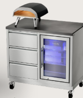
quub serie Mobile Outdoorküchen Module