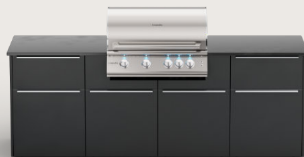
elements serie Smarte Outdoor Einbauküche

Mehr Produkte von der Outdoor Cooking Marke aus Deutschland WWW.VIVANDIO.COM